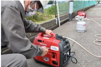
ボンベに接続されたポータブルLPガス発電機 = 8月1日、秋田市